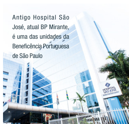
Antigo Hospital São José, atual BP Mirante, é uma das unidades da Beneficência Portuguesa de São Paulo